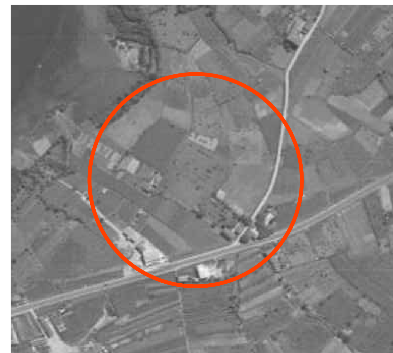
FOTO AEREA 1953